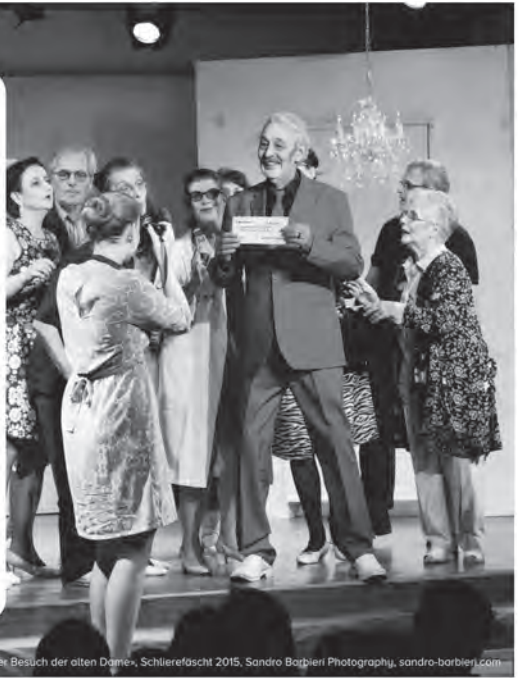
Foto: «Der Besuch der alten Dame», Schlierenföschli 2015, Sandro Barbieri Photography, sandro-barbieri.com

E-Mail: info@teatrix.ch Telefon: +41 78 844 43 00